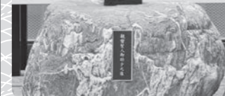
親鸞聖人御幼少の像

【御用】 浄源寺の歴史や文化を伝えるために、本寺では「浄源寺の歴史」をテーマとした展示を行っています。浄源寺の歴史や文化を伝えるために、本寺では「浄源寺の歴史」をテーマとした展示を行っています。